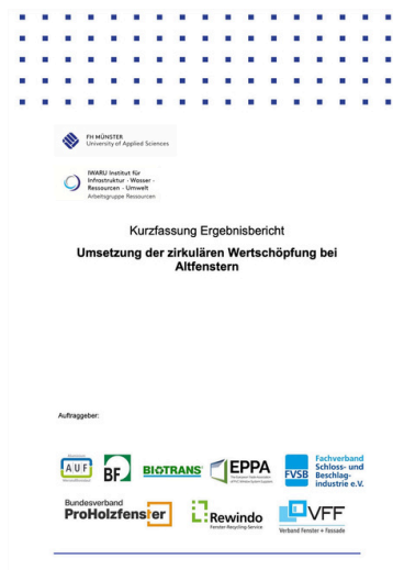
Verbandestudie zum Umgang mit Altfenstern.

Die „dritte Phase“ des Forschungsprojekts nimmt die praxisnahe Umsetzung dieser und weiterer Maßnahmen in den Blick. Das Ziel: Technische und wirtschaftliche Lösungen, die eine geschlossene Wertschöpfungskette ermöglichen und Holzfenster als nachhaltige Alternative weiter stärken. Zur Studie geht es hier .