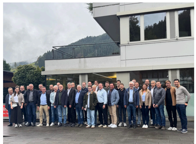
Beirat und Zukunftswerkstatt trafen sich bei Fensterbau Schillinger in Oberwolfach.