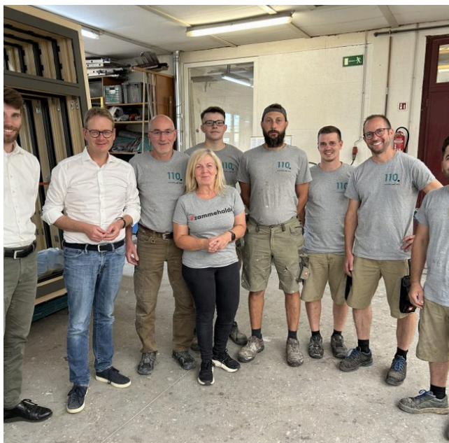
Thomas Gebhart MdB bei der Schreinerei Vollmer in Lustadt.

Bei seinem Besuch bei der Schreinerei Vollmer in Lustadt zeigte sich Dr. Thomas Gebhart MdB (CDU) beeindruckt von der Innovationskraft und Präzision im Holzfensterbau. In Gesprächen mit der Familie Vollmer ging es um zentrale Herausforderungen der Branche: Bürokratieabbau, die stärkere Förderung des nachhaltigen Werkstoffs Holz und fairere Vergabeverfahren, die Regionalität und Qualität belohnen.