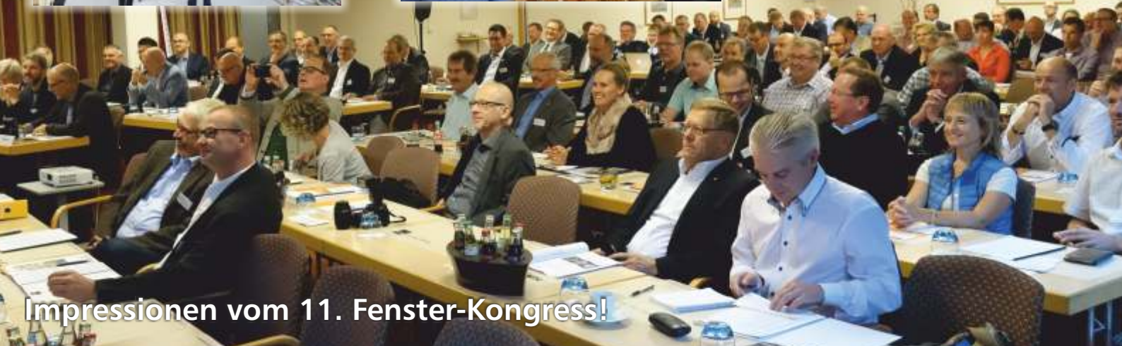
Impressionen vom 11. Fenster-Kongress!